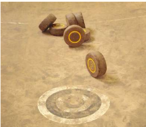
La bourle, le jeu traditionnel de Wattrelos