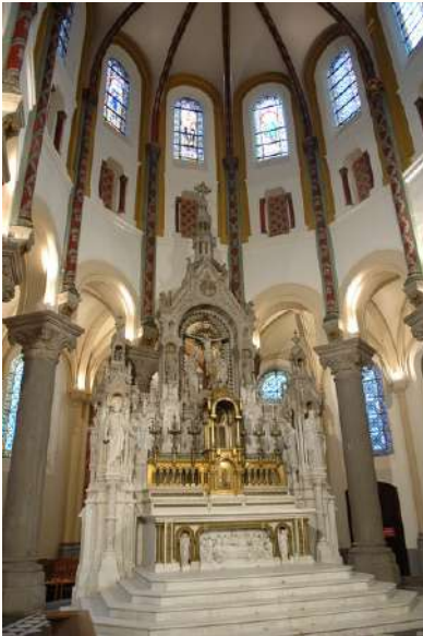
Chœur de l'église Saint-Maclou

L'église Saint-Maclou (place Jean Delvainquière) : Cette église a été construite en 1882 selon les plans de l'architecte Charles MAILLARD, l'un des plus prestigieux architectes tourquennois du XIXème siècle. Elle est de style néo-roman, munie d'arcs et de voûtes en plein cintre, et comporte une importante ornementation en pierre. Les éléments décoratifs ont également été réalisés par des artistes de renommée comme Gustave PATTEIN pour la chaire à prêcher ou le sculpteur VERLINDEN pour le maître-autel.