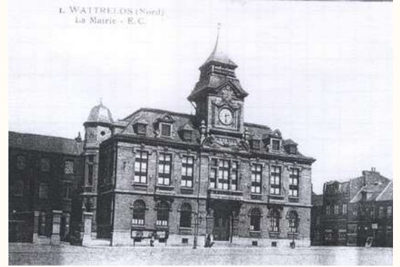
L'Hôtel de Ville à sa construction en 1911

Le bâtiment fut entièrement rénové en 1968 et sa façade modernisée.