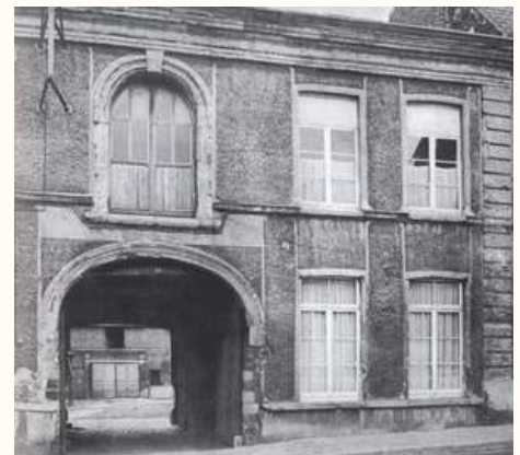
Le cabaret au XIX ème siècle

Le Cabaret le Grand Sébastien (32 rue P. Catteau) : Cette bâtisse construite en 1721 est le plus ancien bâtiment encore debout de notre ville. Il abritait le cabaret le Grand Sébastien et accueillit la première maison communale en 1790. Il va dès lors servir aux mariages, qui ont lieu au rez-de-chaussée à droite, tandis qu'à gauche siège le conseil municipal. Le premier étage accueille le secrétariat et l'état-civil. Les proclamations officielles se font depuis la porte fenêtre située au-dessus du portail.